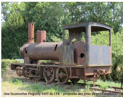
Une locomotive Pinguely 030T du CFB – propriété des amis du petit Anjou