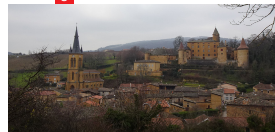
Le village de Jarnioux

7 Continuer le chemin en direction du Bois de Chassagne. À la sortie du bois, poursuivre tout droit. Longer le mur en pierre qui entoure des vignes. Arriver au pied du château de Rochebonne, place des Marronniers. 8