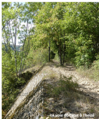
La voie du tacot à Theizé

Aujourd'hui reconvertie en itinéraire de randonnée dans sa partie sud entre Liergues et Sarcey, la Voie du Tacot sillonne le pays des Pierres Dorées et relie une dizaine de villages sur une distance d'environ 25 kilomètres.